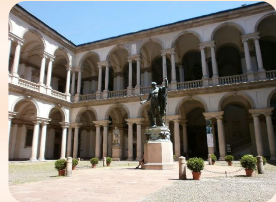
Pinacoteca di Brera