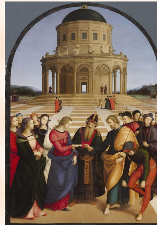
Raffaello, Le Mariage de la Vierge