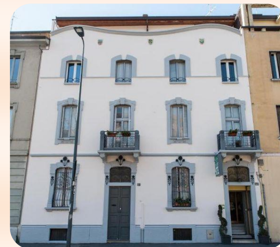
Hotel The Best