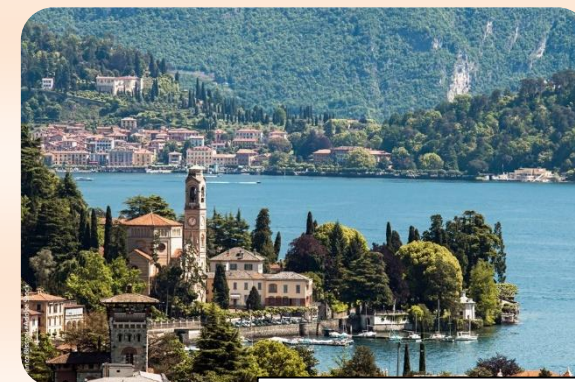
Rivages du lac de Côme