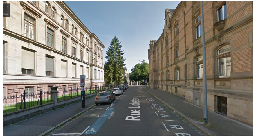
Rue Lobstein: vue des emplacements de stationnement pour bus